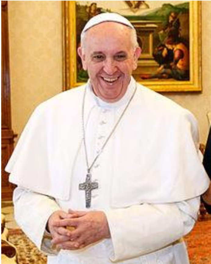
Papst Franziskus (2013- )