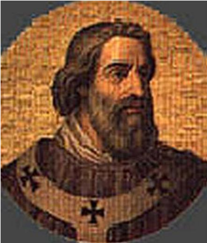
Papst Urban IV. (1261-1264)

21. Devise: „ HIERUSALEM CAMPANIA “ = Jerusalem aus Champagne