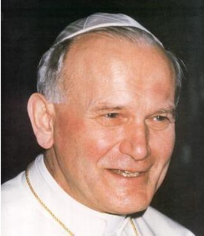
Papst Johannes Paul II (1978-2005)

= Von der Bedrängnis (Geburtswehen) der Sonne