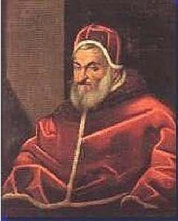
Sixtus V. (1585-1590)

„Dictionnaire historique de la Papauté“ hat eine interessante Erklärung dafür: