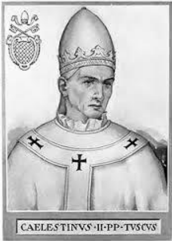
Cölestin II. (1143-1144)

= Aus dem Schloss / der Festung des Tibers