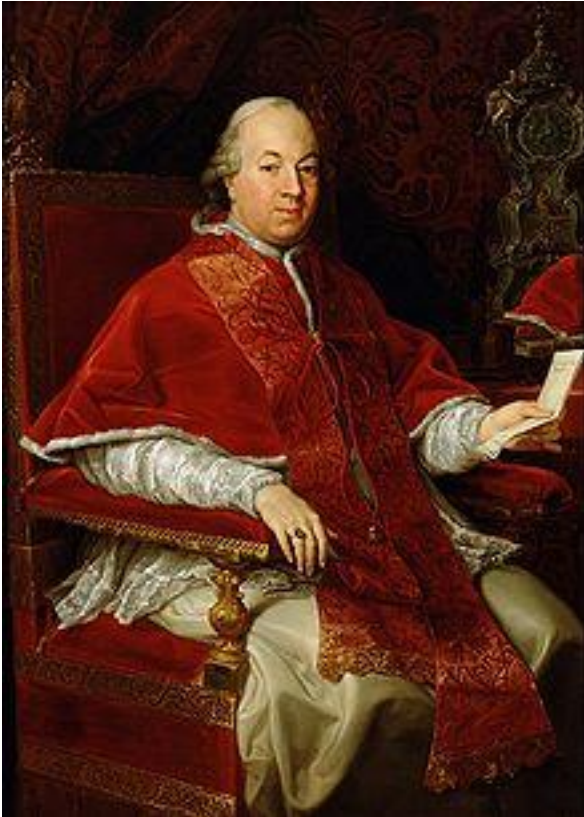
Papst Pius VI. (1775-1799)

In einem kirchenfeindlichen Europa bereiste er den Kontinent, um bei Kaisern und Königen den Glauben wieder zu beschwören. Dies war insofern eine Sensation, da über mehrere Jahrhunderte vorher kein Papst den Vatikan verlassen hatte.