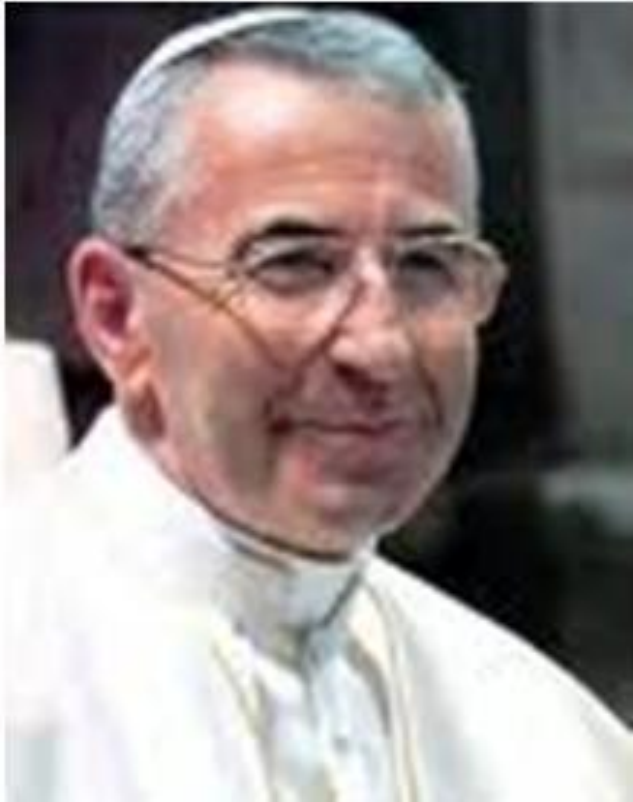
Papst Johannes Paul I (1978)